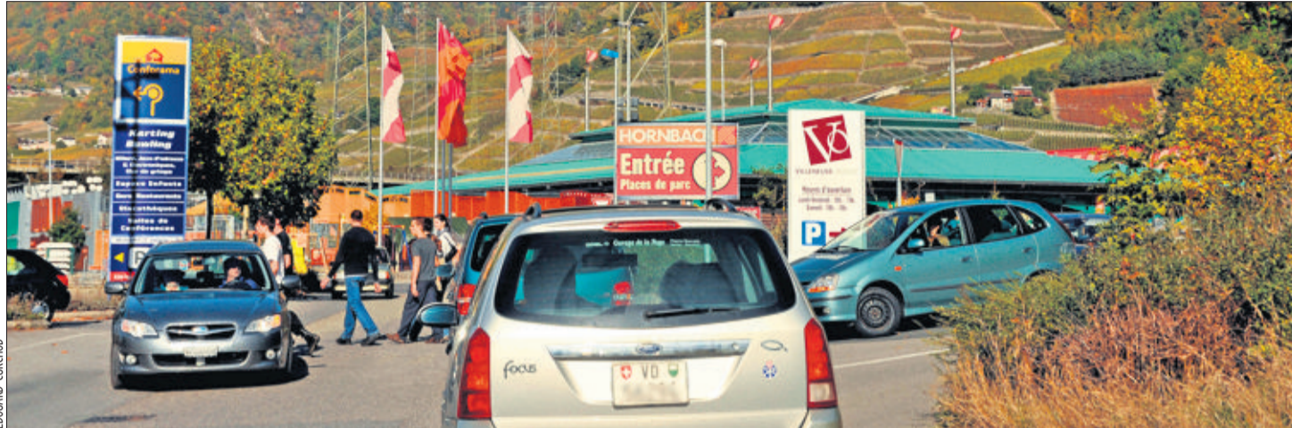
ÇA BOUCHONNE En fin de semaine, ou pendant les jours fériés en Valais ou dans le canton de Fribourg, l'accès à la zone industrielle de Villeneuve relève du parcours du combattant. VILLENEUVE, LE 21 OCTOBRE 2009

Une théorie confirmée en ce mardi matin: la longue colonne de voitures qui se forme au feu rouge en raison des travaux de correction de l'Eau-Froide rend la circulation malaisée. Assez