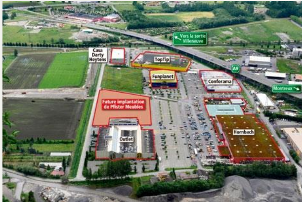
Jouxant l'autoroute, la zone industrielle regroupe déjà de nombreux commerces. Arrivés il y a sept ans, Top Tip partage ses murs avec Ochsner et Qualipet.

DÉVELOPPEMENT | Dès 2011, le géant posera ses meubles dans un nouveau bâtiment. Bien fréquentée, la zone attend encore d'autres arrivées.